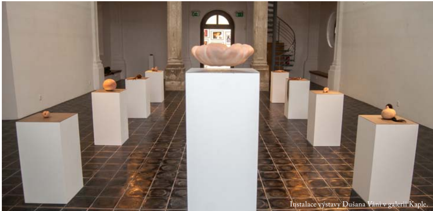
Instalace výstavy Dušana Váni v galerii Kaple.

V současné době se v prostorách bývalé věžeňské kaple, nyní galerie Kaple, prezentuje sochař Dušan Váňa (*1982), jež svou první výstavu ve Valašském Meziříčí nazval jednoduše a výstižně Sklizeň. V hlavním galerijním prostoru, balkóně i sklepení můžete shlédnout třináct silikonových objektů, které dokonale napodobují skutečné ovoce, ale ve skutečnosti se jedná o antropomorfní tvary evokující lidskou kůži. Tvorbu Dušana Váni shrnula Marika Svobodová: