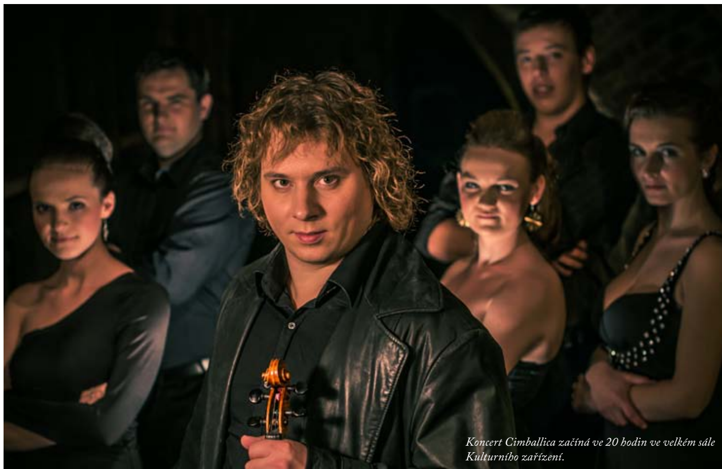
Koncert Cimballica začíná ve 20 hodin ve velkém sále Kulturního zařízení.

Součástí Mezinárodního festivalu poezie jsou každoročně také doprovodné programy. Toho prvního se letos ujme skupina Cimballica, která přináší originální díla, odvážné aranže, neobvyklé hudební kombinace, nový image a netradiční pojetí vážné hudby, folkloru a filmové hudby.